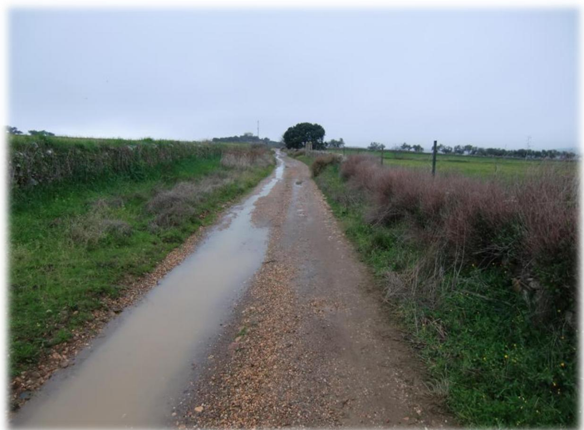
Het heeft de voorbije nacht flink geregend en dat is duidelijk te zien onderweg. Gelukkig houden we het nu wel zo goed als droog.