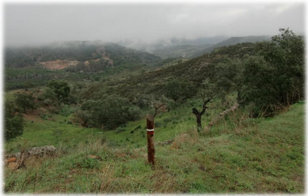
Er is wat lage bewolking en het is nogal naar de frisse kant maar het blijft droog en dat is toch het voornaamste.