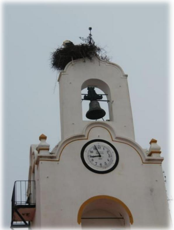
Bij de start verkennen we meteen het plaatselijke kerkhof van Barrancos. Barrancos ligt vlak tegen de grens met Spanje. Links onderaan is onze vakantiewoning en onze huurauto.