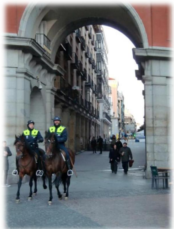
Plaza Mayor in Madrid waar altijd wel mensen zijn. Ook de politie te paard is er aanwezig.