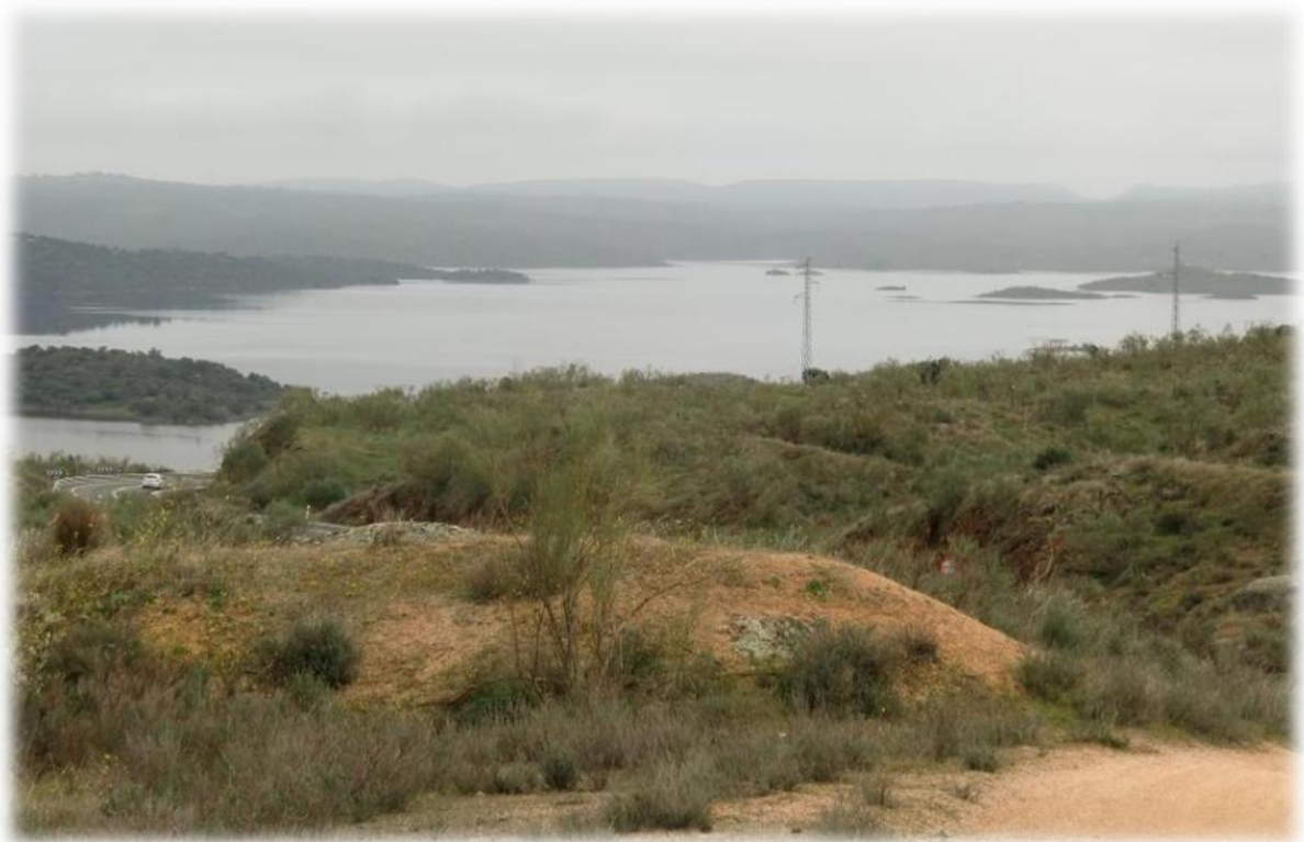
We naderen het Embalse de Jose Maria Oriol. Dat is een stuwmeer dat wordt gevoed door de Taag. Het meer draagt de naam van de directeur die in 1969 de dam heeft gebouwd.