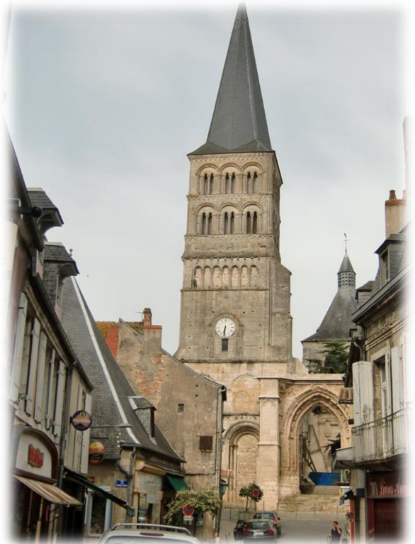
Op het hoogste punt van de stad staan nog overblijfselen van de Benedictijnenpriorij uit de 13 de eeuw. Een gedeelte kan nog bezocht worden door het publiek.