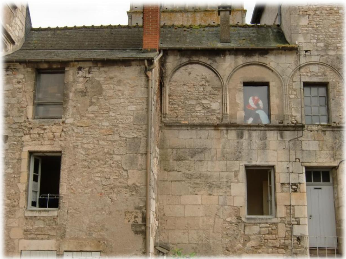
Het gebouw hierboven is de refuge. Waar het linker raam open staat is de slaapruimte en waar het rechter raam open staat is de keuken.