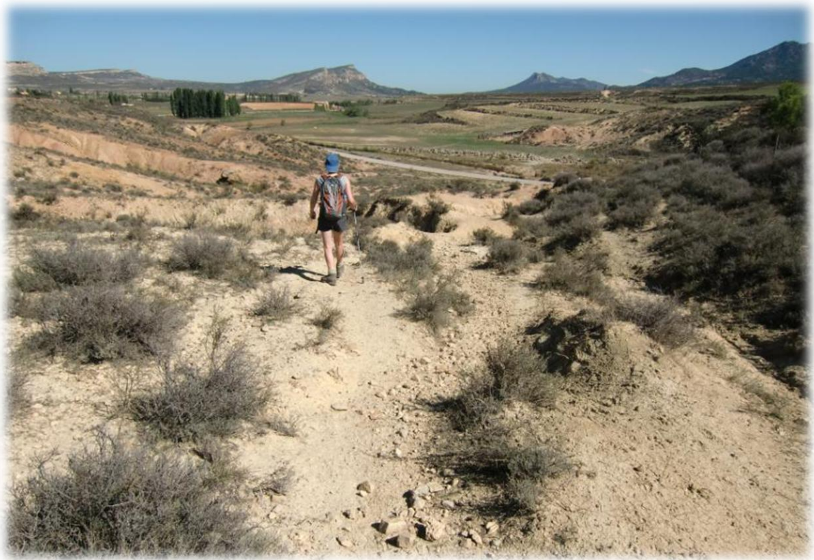
We lopen voorbij enkele hopen vergeten bamboestengels die er, zo te zien, al jaren liggen.