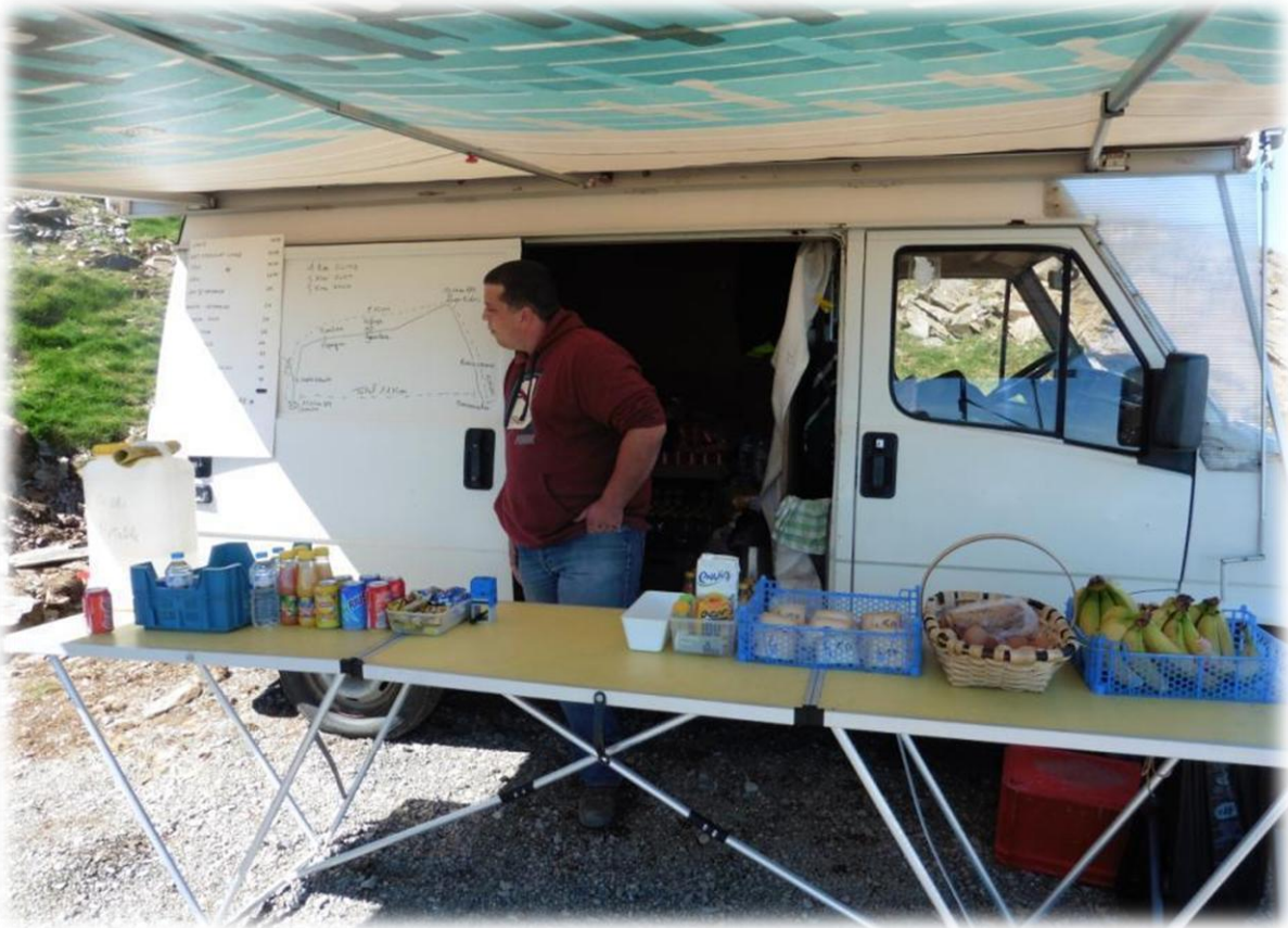
Maar dan is er plots toch een bestelwagen waar frisdranken en versnaperingen te verkrijgen zijn. Op de schuifdeur van het voertuig staat de rest van het traject getekend.