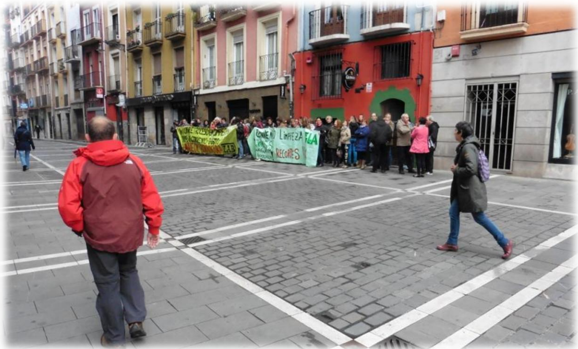
In de kathedraal van Pamplona bevindt zich de graf tombe van Karel III van Navarra en diens echtgenote Leonor van Castilië. Beiden liggen er al sinds 1509. In het centrum is tevens een kleine betoging aan de gang maar veel stelt het niet voor.