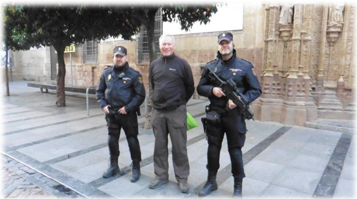
Na vertoon van mijn dienstkaart en een kort gesprekje mag ik plaats nemen tussen mijn spaanse collegas voor een foto.