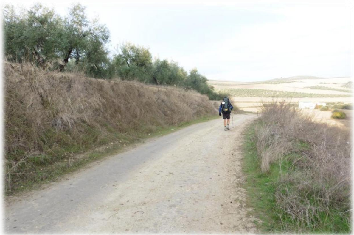
We doorlopen het dorpje Espejo dat gedomineerd wordt door de meubelindustrie.