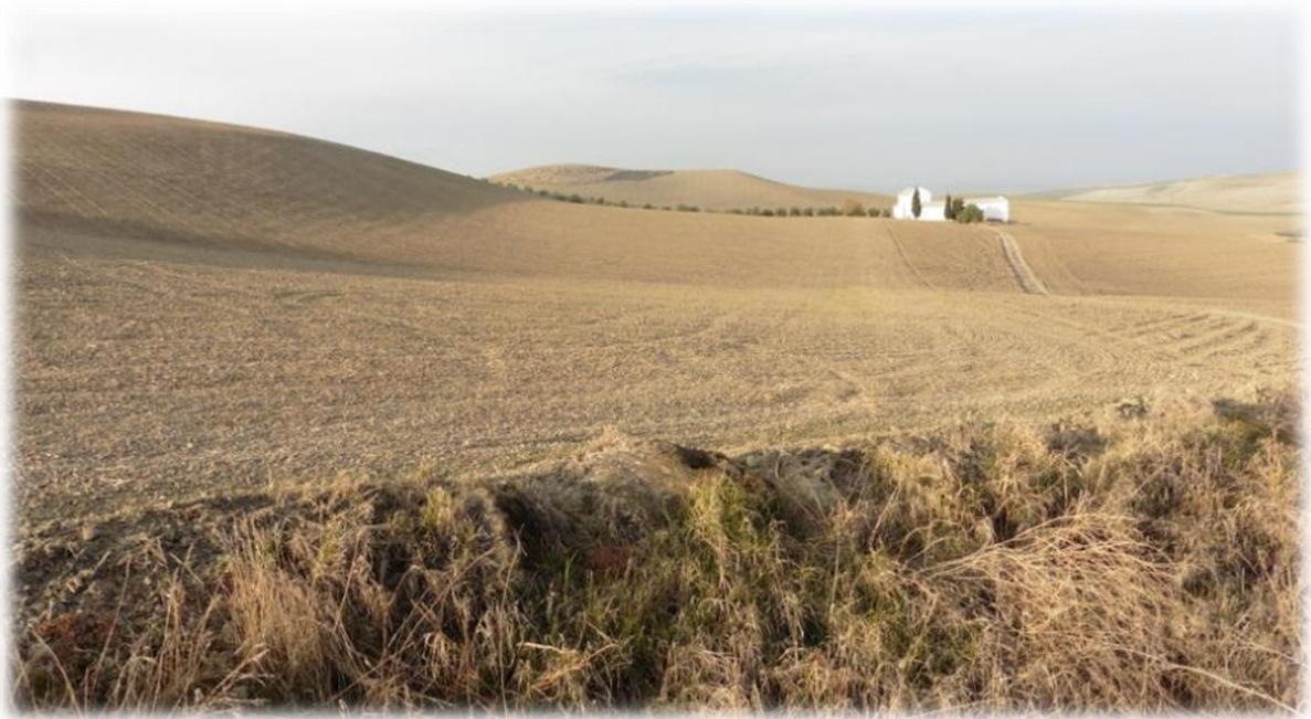
Over de berg meteen een ver uitzicht over het bekken van Córdoba met gloeiende akkers zover het oog reikt.