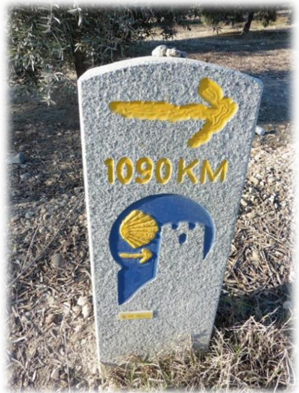
1090 km nog tot Santiago de Compostela staat hier keurig aangegeven op de basaltstenen wegwijzer met het reliëf van de Mozárabe.