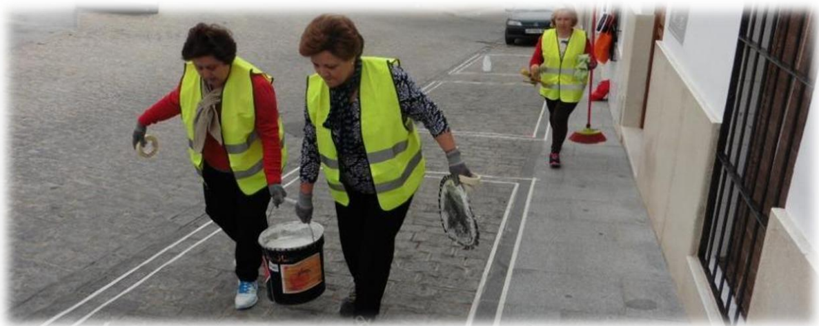
Deze dames zijn druk in de weer met het schilderen van parkeervakken. Hier doen ze dit nog geheel handmatig, eerst met tape alles afplakken en vervolgens schilderen met de borstel.