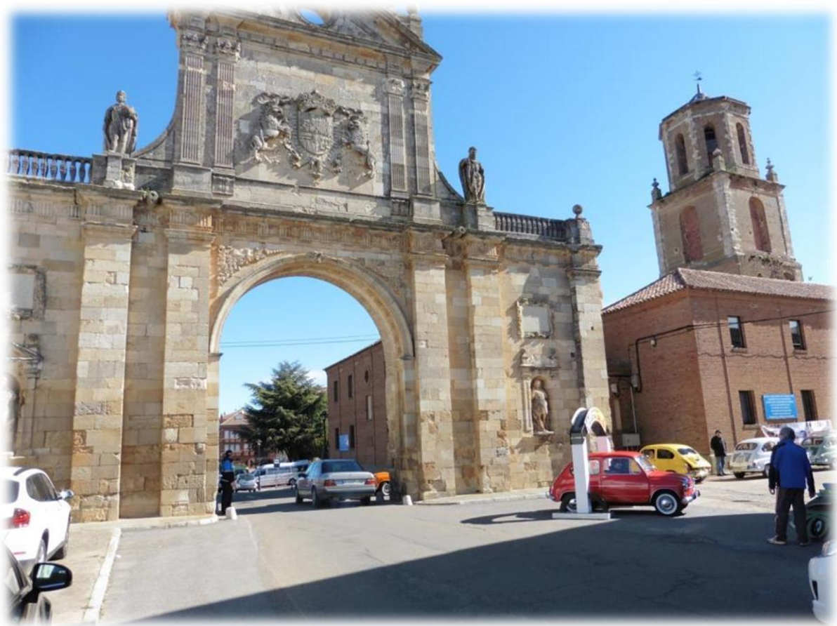
Prachtige boog, overblijfsel van de grote San Benito benedictijner abdij. De abdij zelf is al lang verdwenen.