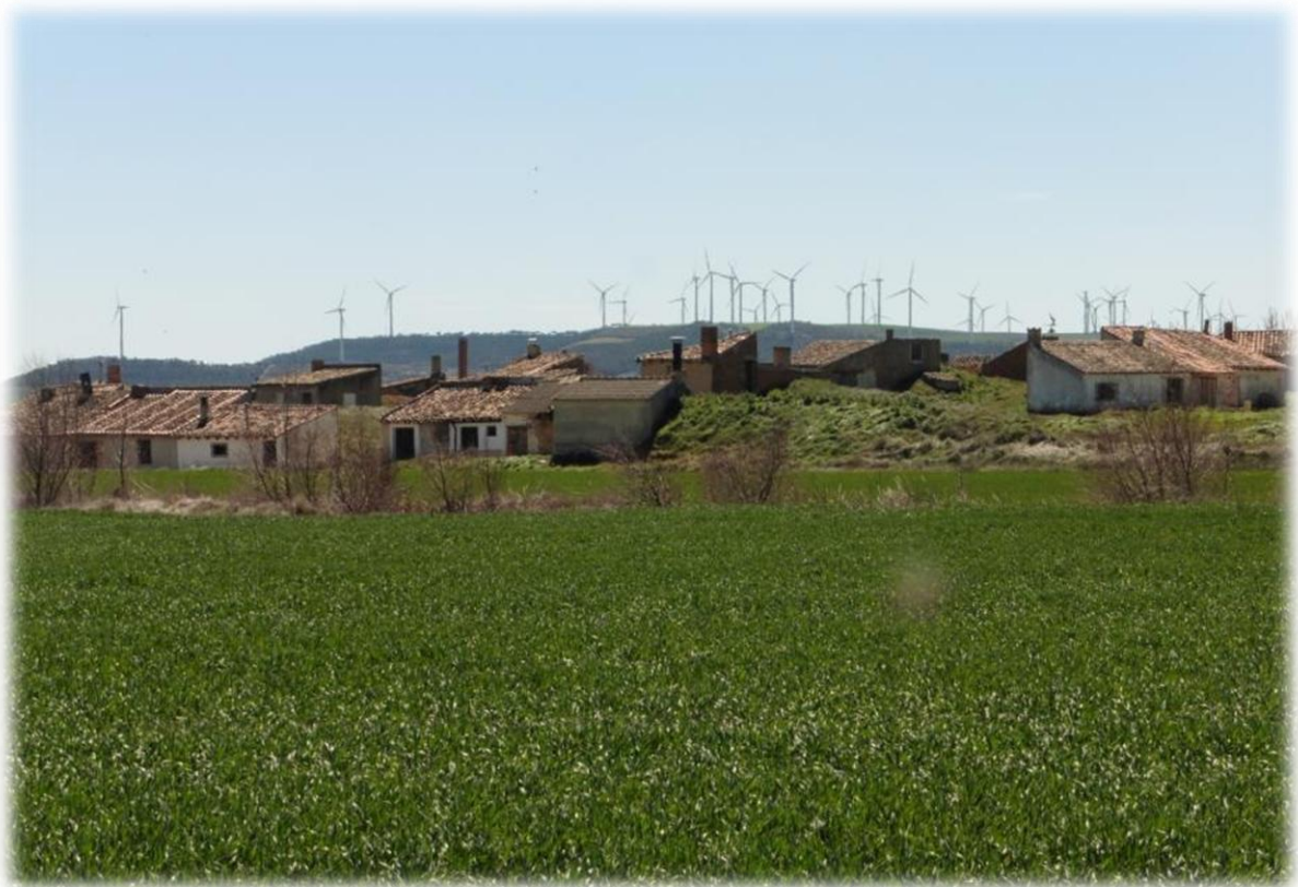
Ik kom voorbij een spookdorpje, allemaal leegstaande huizen. Je ziet dat wel meer in Spanje.