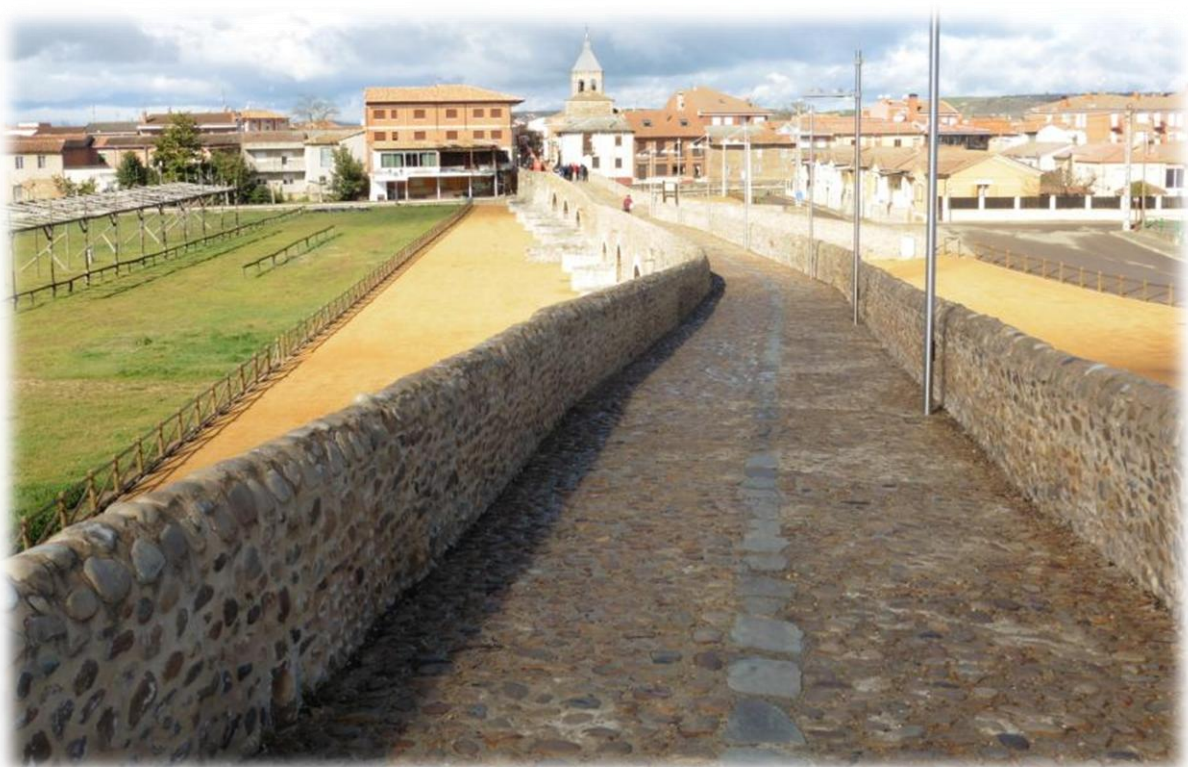
De pelgrimsweg voert over de bekende romeinse brug, de Paso Honroso in Rio Orbigo. Deze brug dateert uit de 13 de eeuw en is 300 meter lang.