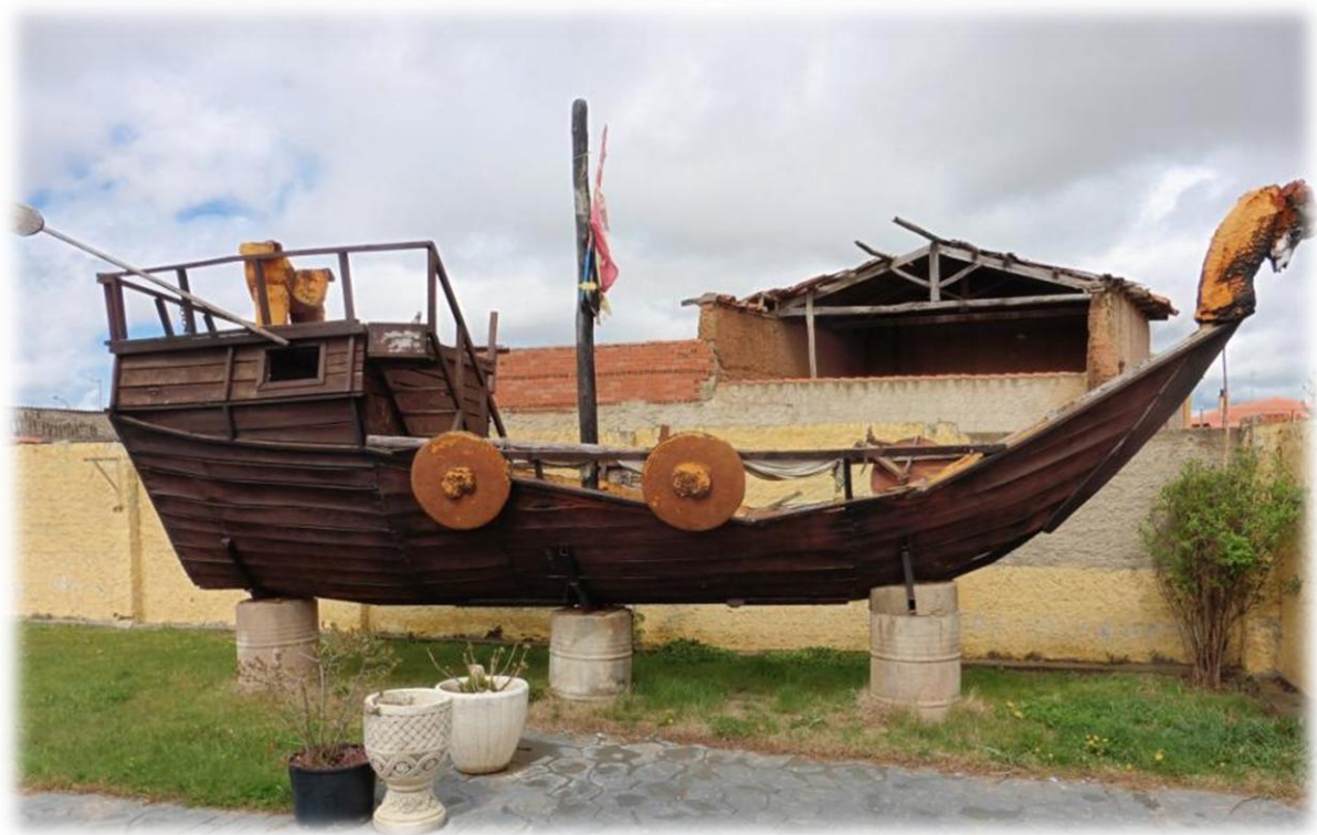
In Villar de Mazarife hou ik het voor bekeken en tijdens mijn zoektocht naar een overnachtingsplaats kom ik zowaar deze boot tegen.