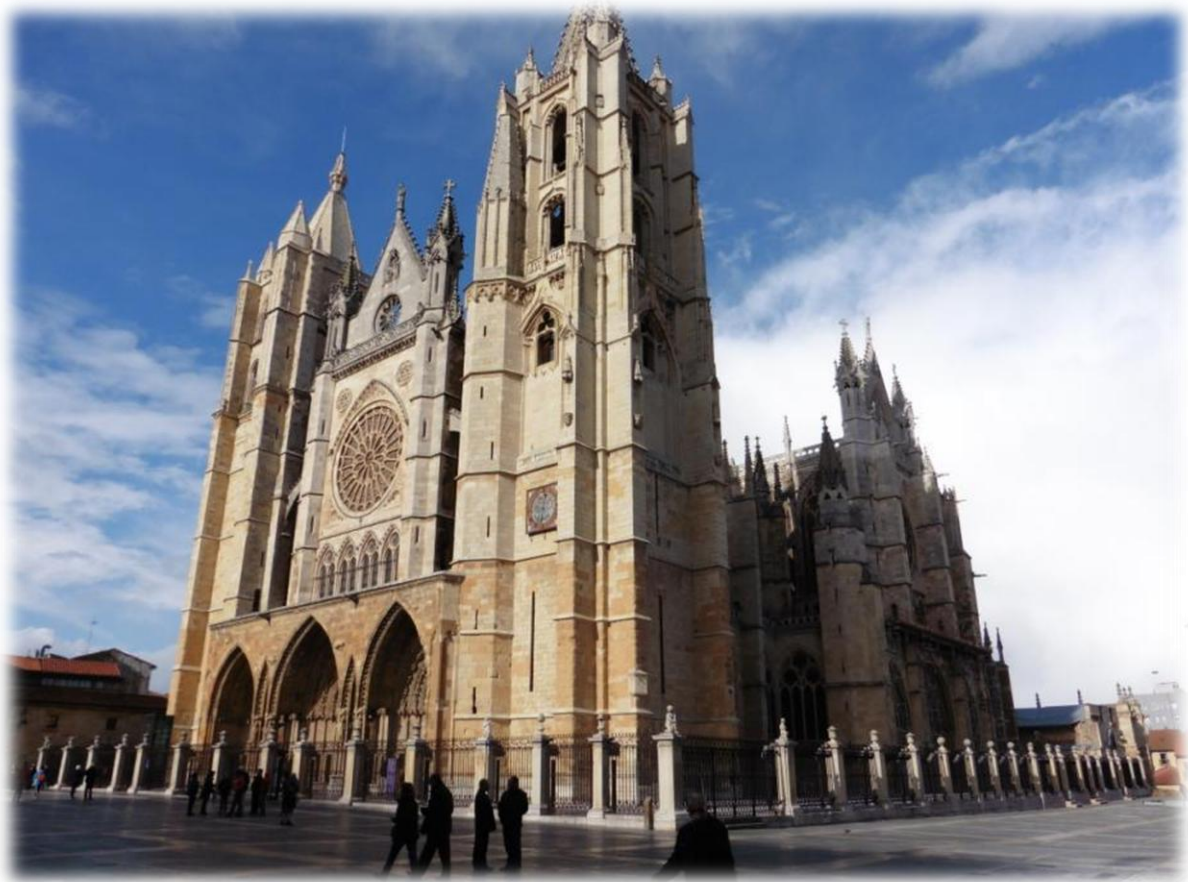
Ten noorden van de kathedraal lopen de resten van de antieke stadswallen die tussen de 11e en 14e eeuw werden opgetrokken.