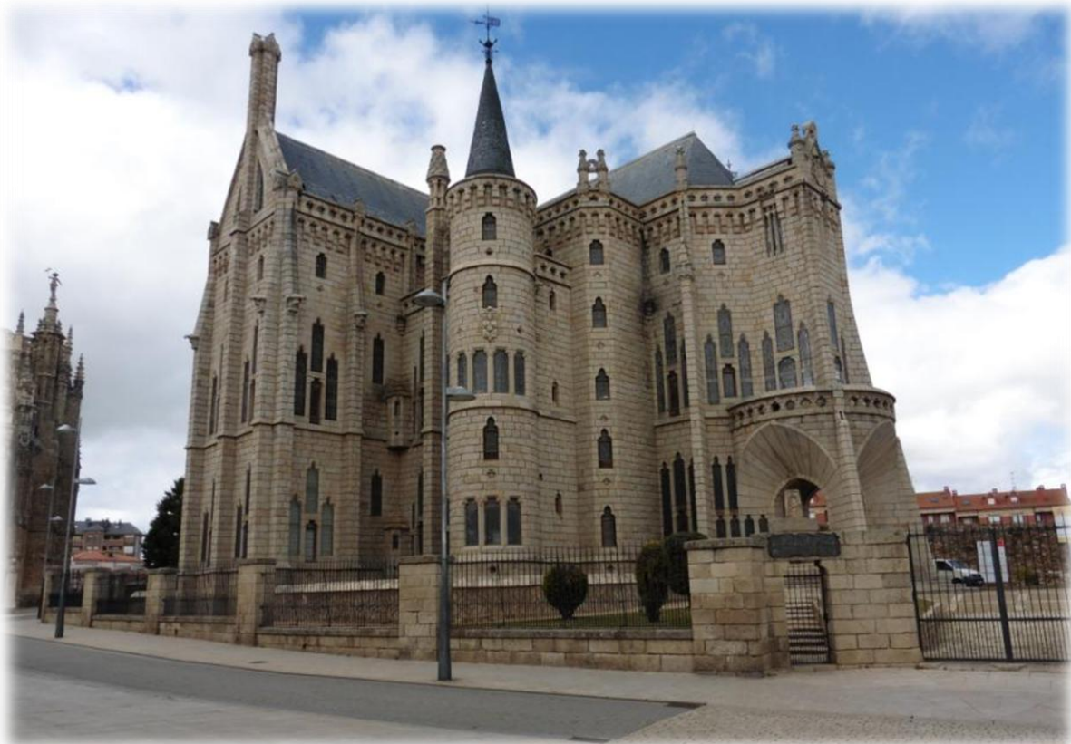
Het bisschoppelijk paleis is opgetrokken in een witte granietsteen die symbool stond voor het wit van het bisschoppelijk gewaad. Men begon aan de bouw in 1887 en het werd pas afgewerkt in 1961.