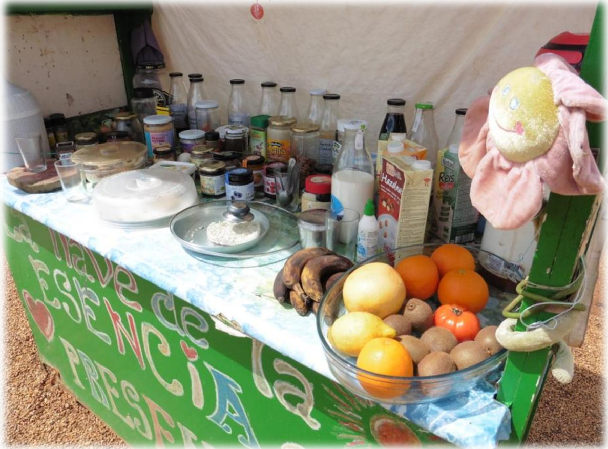
Tussen twee dorpen in staat dit kraampje met allerlei drankjes, warm en koud om de pelgrim te behagen. Het zijn dames uit een naburig dorp die meermaals per dag de voorraad komen aanvullen.