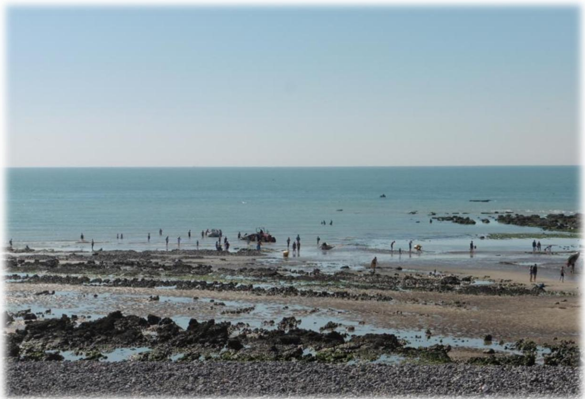
Met het goede weer, en het weekend, zien we onderweg op de stranden heel wat zwemmers.