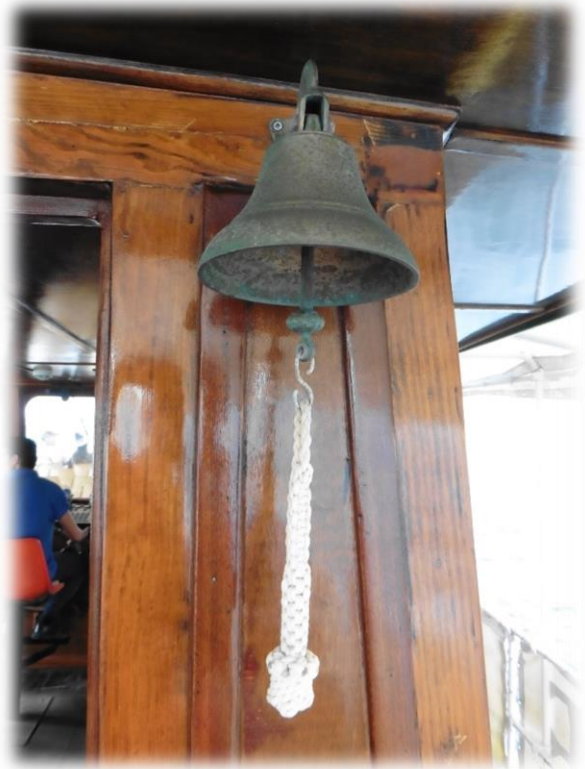
Na de wandeling langs de haven van Sliema spring ik op een van de vele bootjes die de toeristen de omgeving laat zien van op het water.