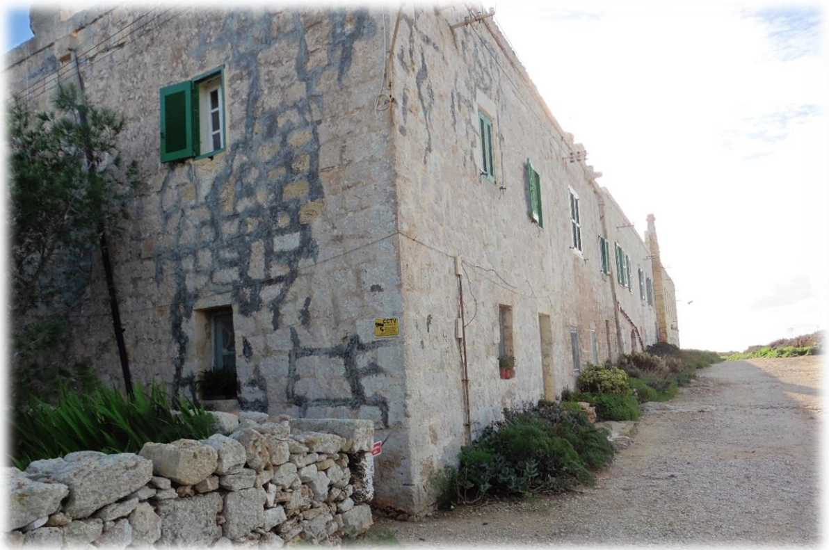
Van 1948 tot 1965 werd dit gebouw gebruikt als school voor de kinderen die leefden op het eiland.