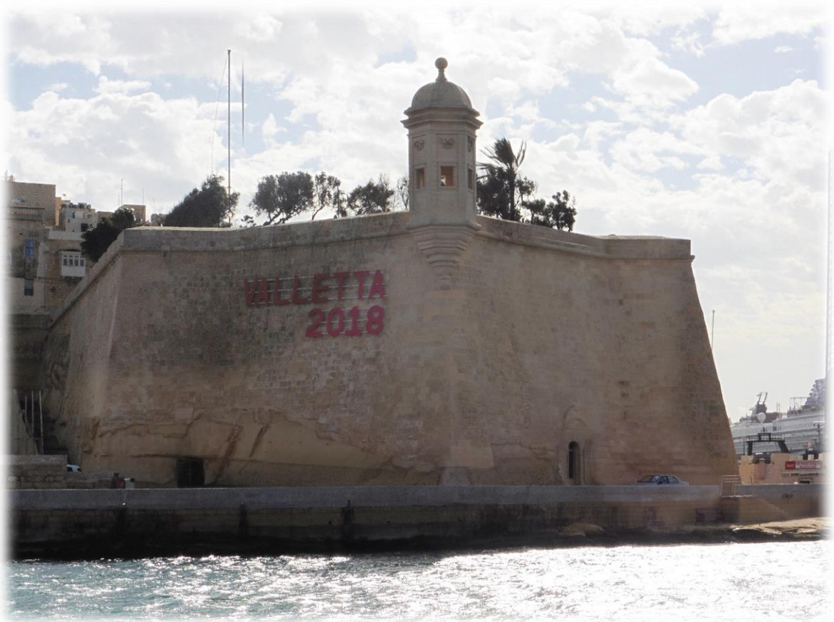
De boot doet ook alle baaien aan van de vestingstad Valletta, de hoofdstad van Malta. Valletta mag in 2018 tevens de naam dragen van Europese Culturele Hoofdstad.