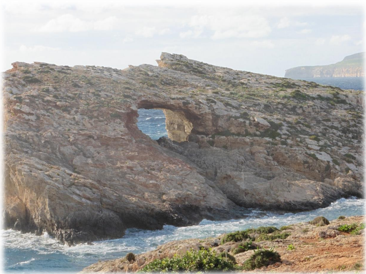
Sommige rotsen hebben gaten die door erosie werden gevormd.