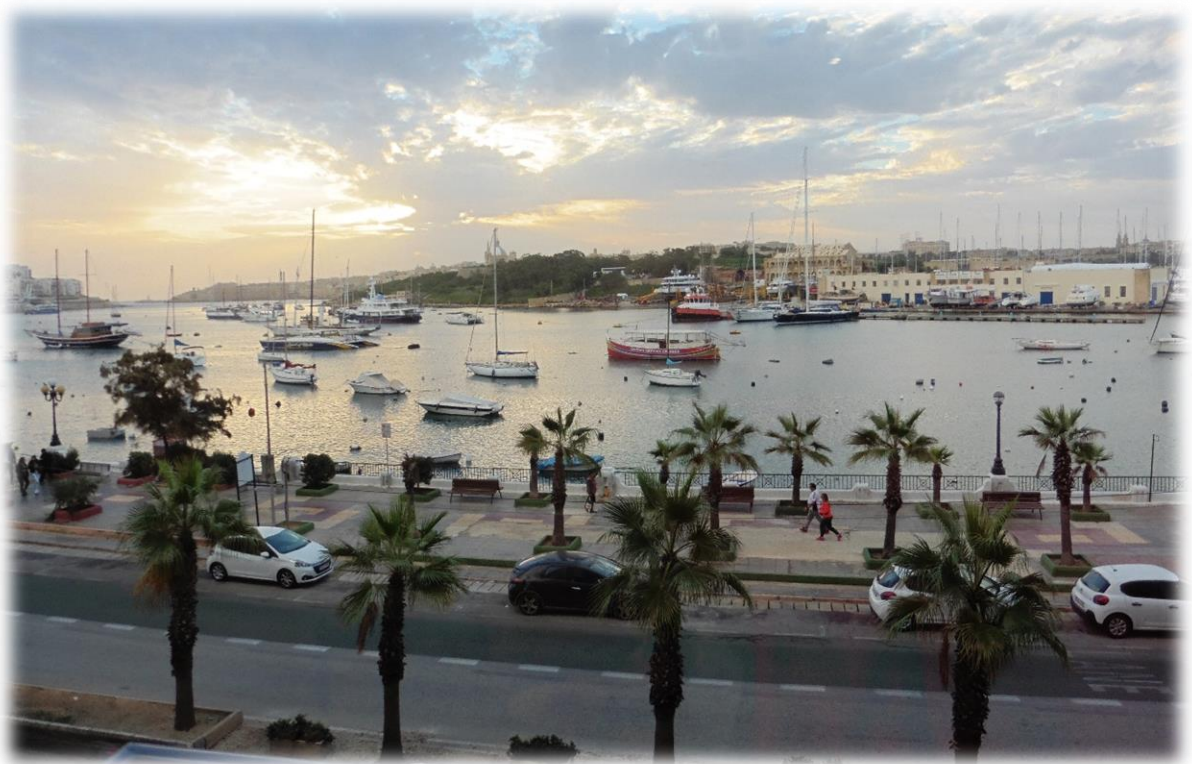
Ook eten doe ik in stijl met zicht op de haven en het eiland Manoel.