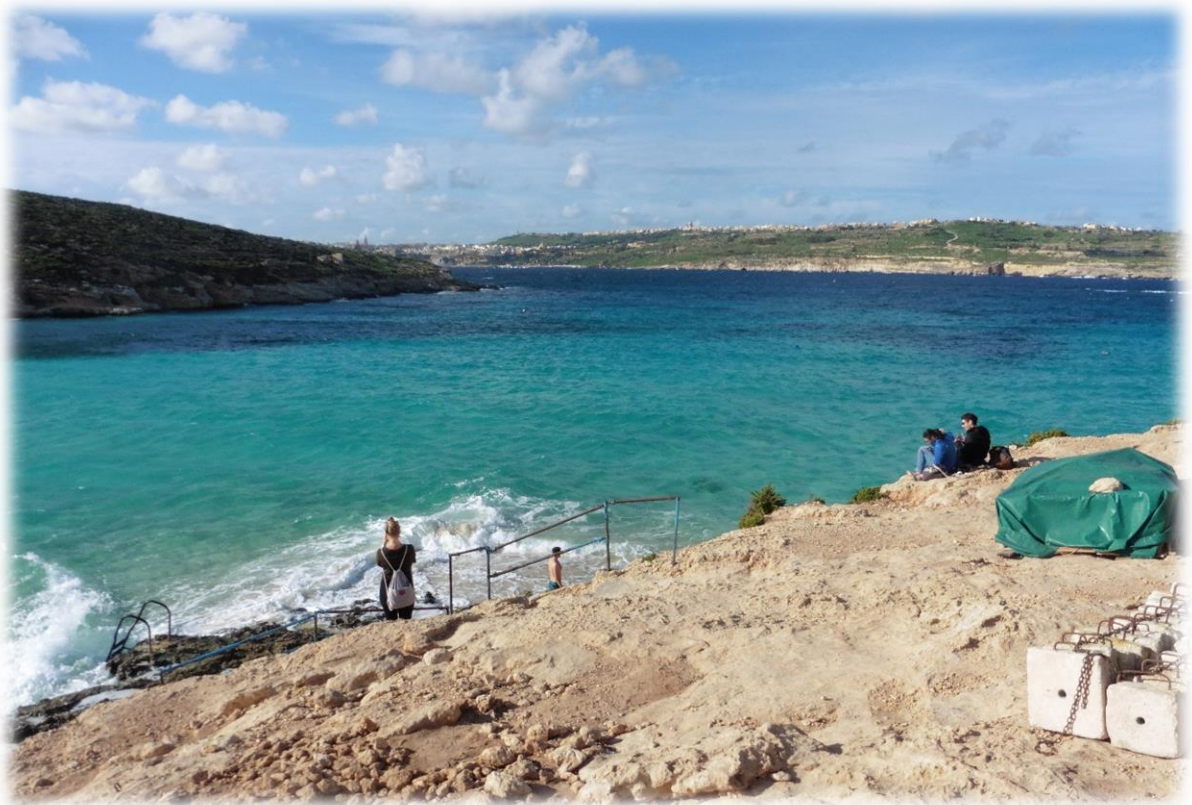
Comino is een ongerept eiland waar geen auto's rondrijden. Vroeger heette het Cumin, naar de wilde plant venkel die er nu nog welig groeit.