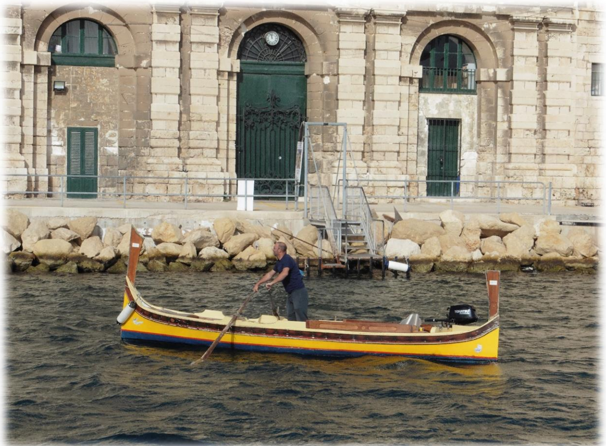
Kleurrijke bootjes varen tussen de grote ferry's door.