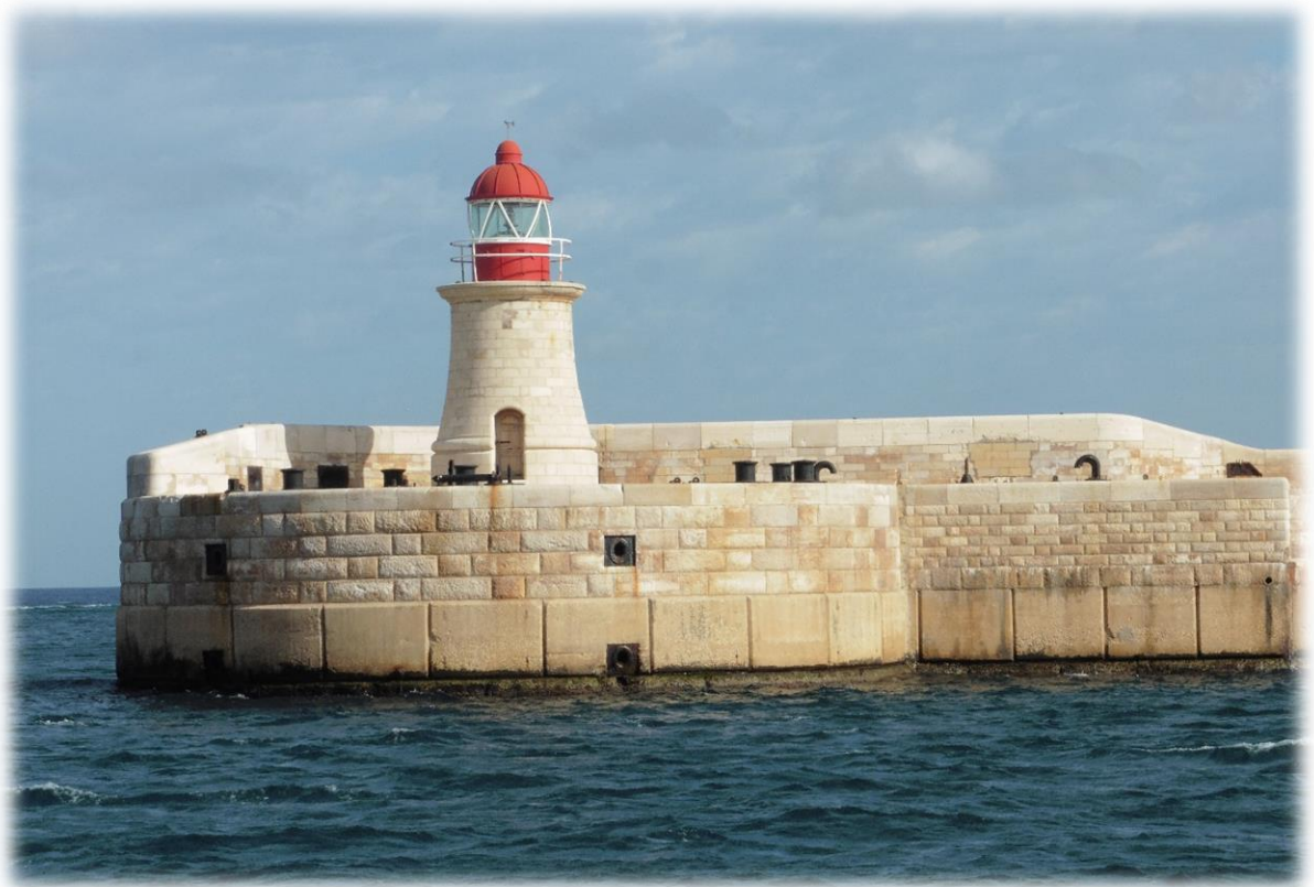
Op alle landpunt van Malta staat er nog steeds een werkende vuurtoren.