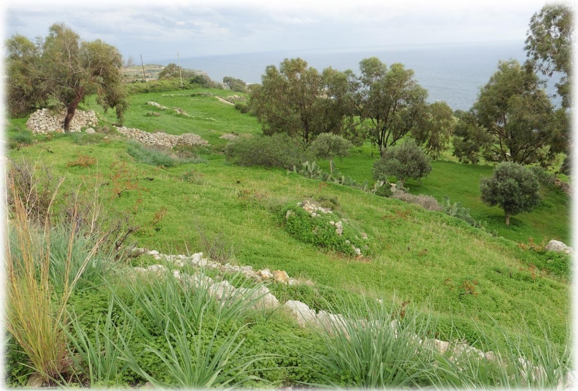
Na verloop van tijd wordt het landschap vlakker en eindigen de kliffen.