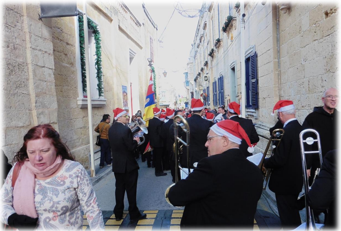
Een Kerstmarkt in Malta.