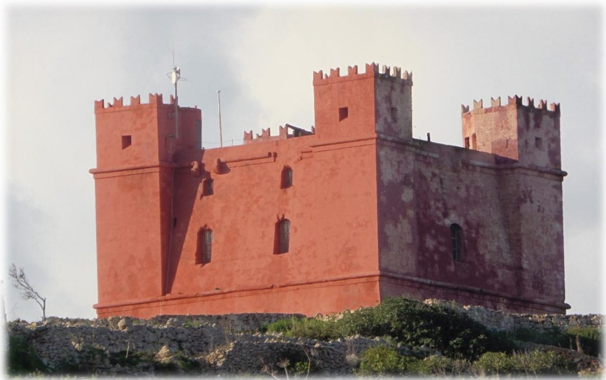
De St-Agatha toren ook wel de Rode Toren (Red Tower) genoemd is onderdeel van een uitgestrekt netwerk van wachttorens en vestingen die werden aangelegd in de 17 de en 18 de eeuw.