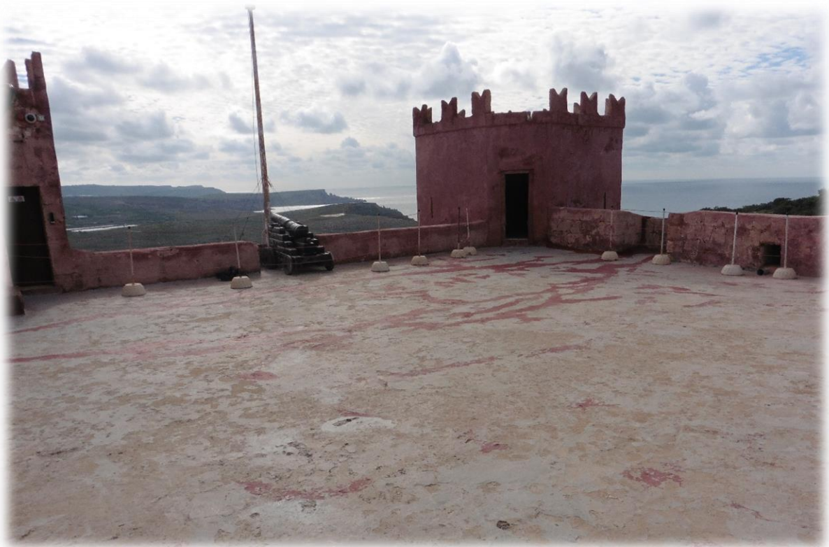
Zij dienden als verdediging tegen de Ottomaanse Turken en Barbaarse zeerovers die opereerden vanuit de kust van Noord Afrika.