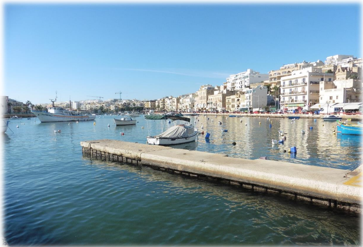
Gozo is een van de drie bewoonde eilanden die deel uitmaken van de eilandengroep Malta.