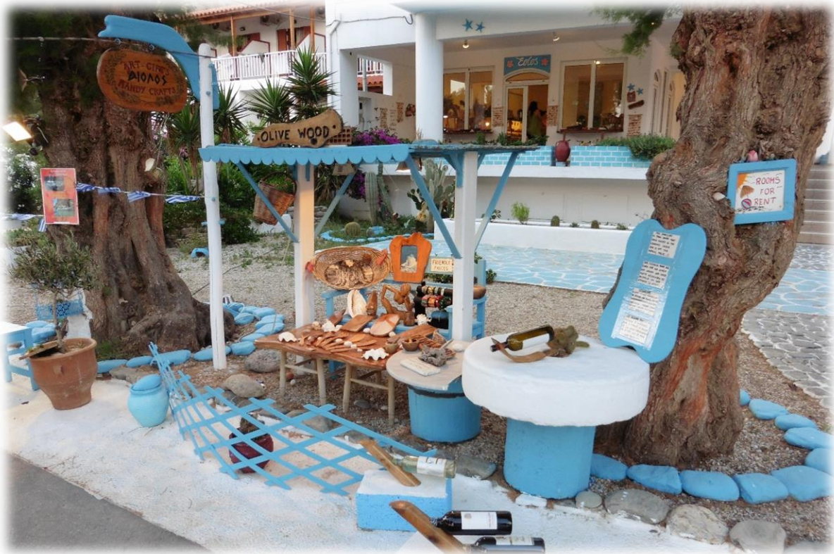
Sougia telt slechts 170 inwoners in de zomer en in de winter slechts een 70 tal. Er is geen apotheek, arts, bankkantoor, politiebureau of toeristisch bureau.