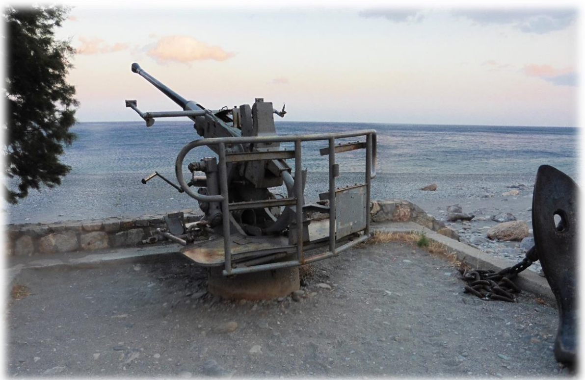
Sougia heeft wel nog mortiergeschut, je weet maar nooit.....En het werkt nog altijd. Ik heb een mortier afgevuurd op een vliegtuig van Ryanair maar miste het vliegtuig net op een haar.