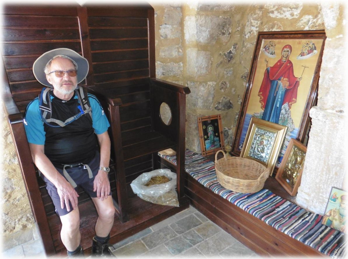
De Byzantijnse kapel Agia Irini (Heilige Irini) was voor de oorlog de kerk van Sougia. Rond de kerk was tevens het kerkhof. Na de oorlog werd een nieuwe kerk gebouwd beneden in het