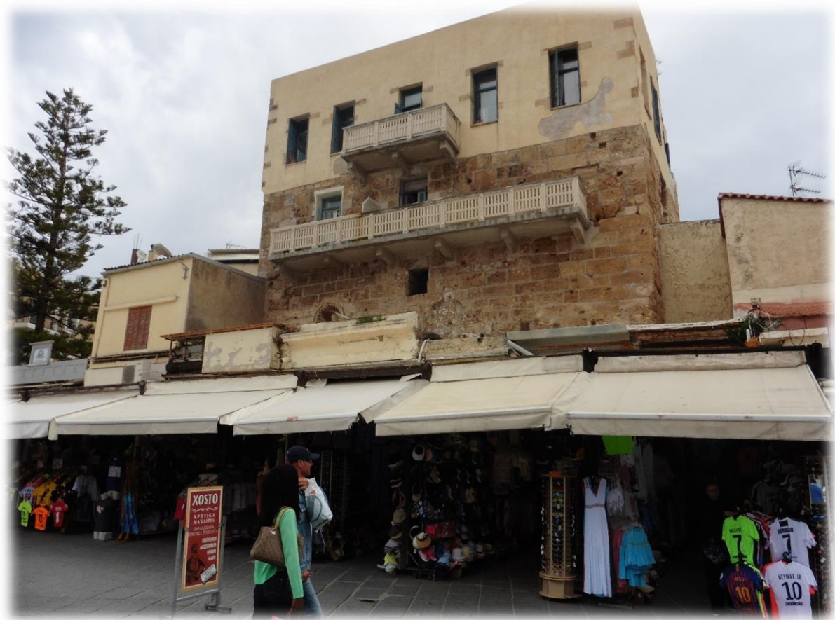
We zijn met een zeer vroege vlucht van BrusselsAirlines aangekomen op de luchthaven van Chania. Vervolgens hebben we de stad Chania bezocht.