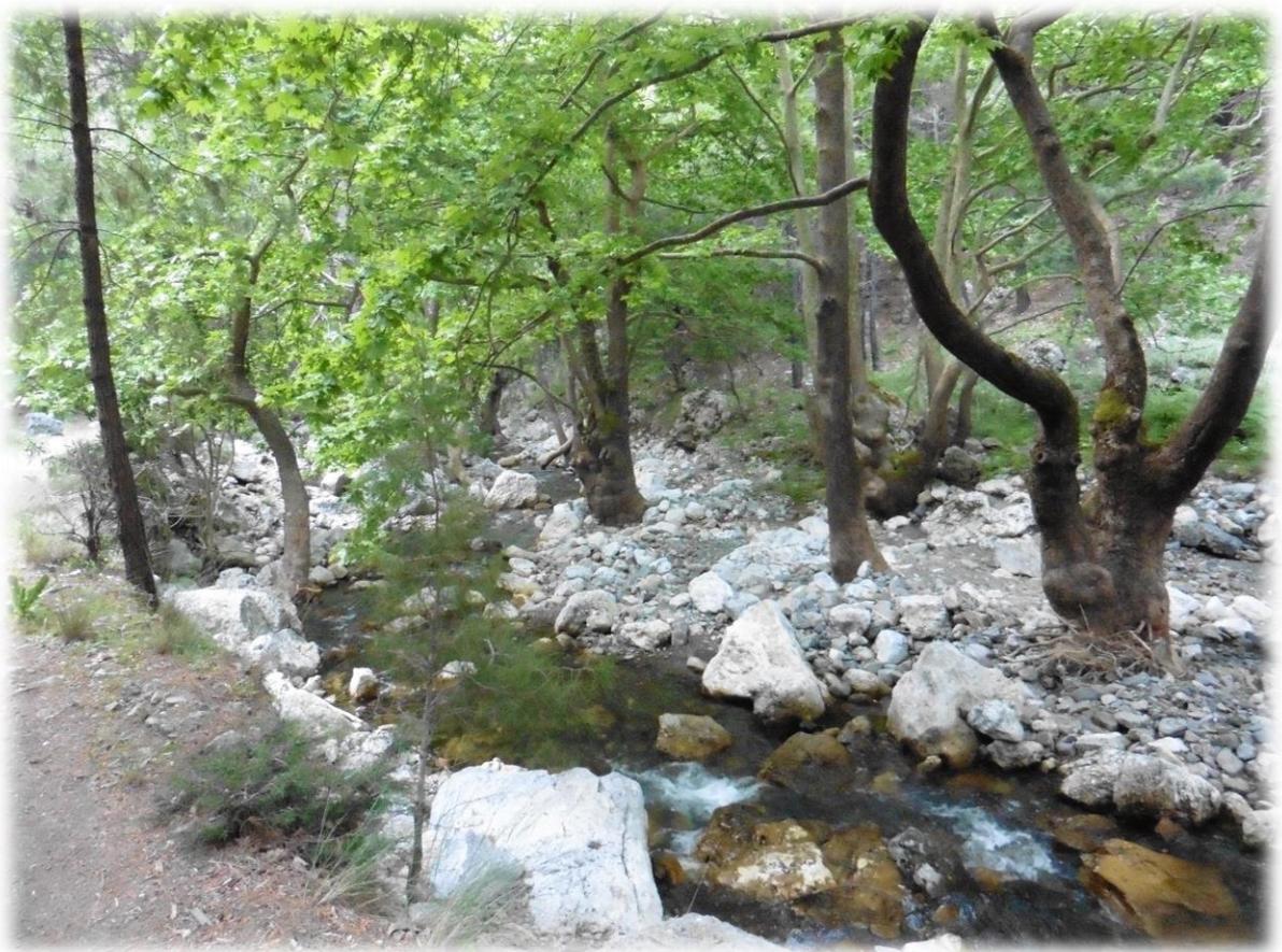
De kloof van Agia Irini is met haar jungleachtige vegetatie in de bovenloop en diverse engten kloofafwaarts, een zeer aantrekkelijke wandeling.