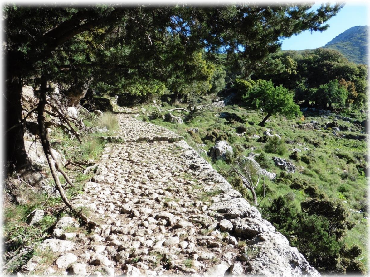
Langs oude lastdierpaden is het eerst flink klimmen door een woest romantisch landschap. Een Kretenzische dame trekt ook de kloof in op zoek naar haar geiten.