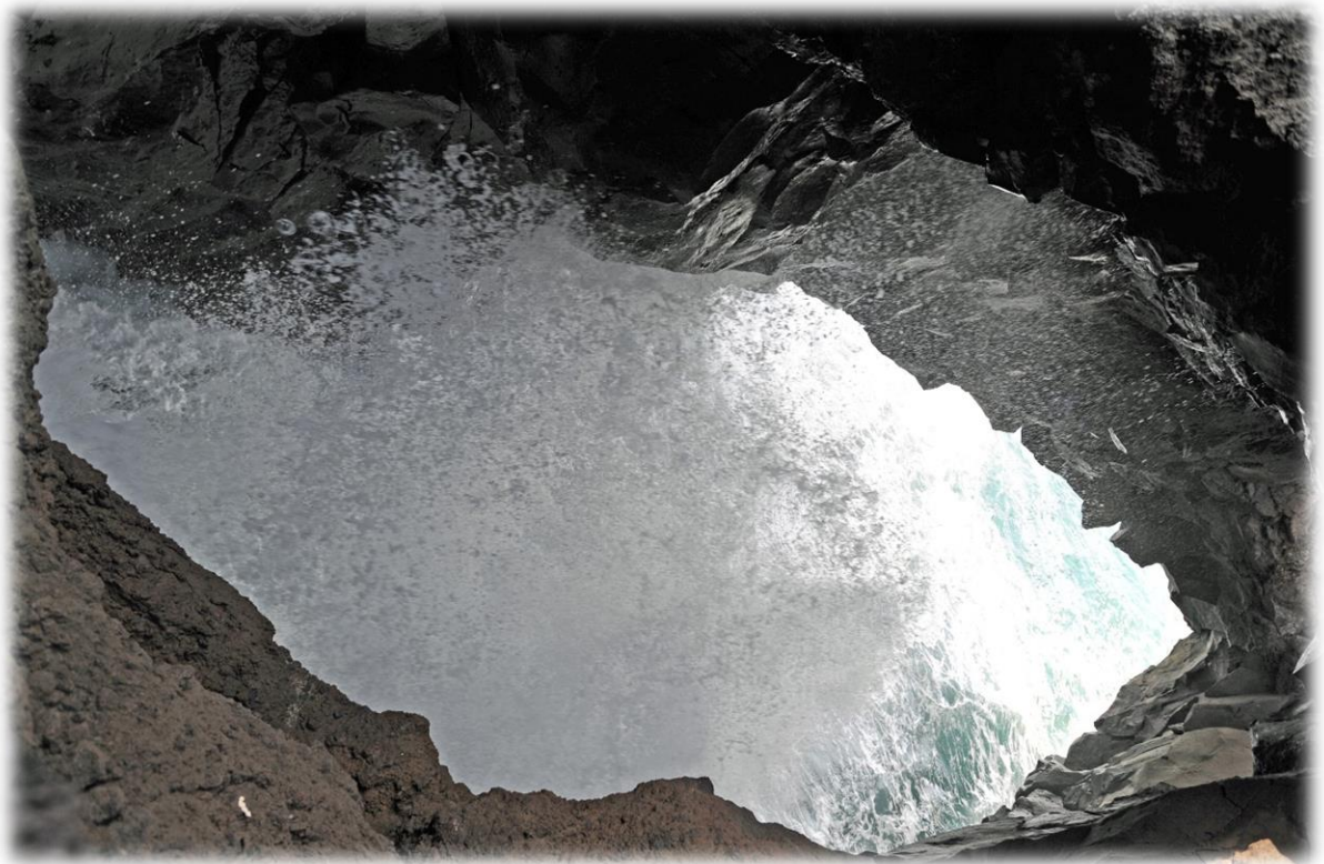
Dichtbij de zoutpannen is er nog een mooi plaatsje, Los Hervideros. Dit natuurfenomeen laat zien wat de natuurelementen kunnen bewerkstelligen.