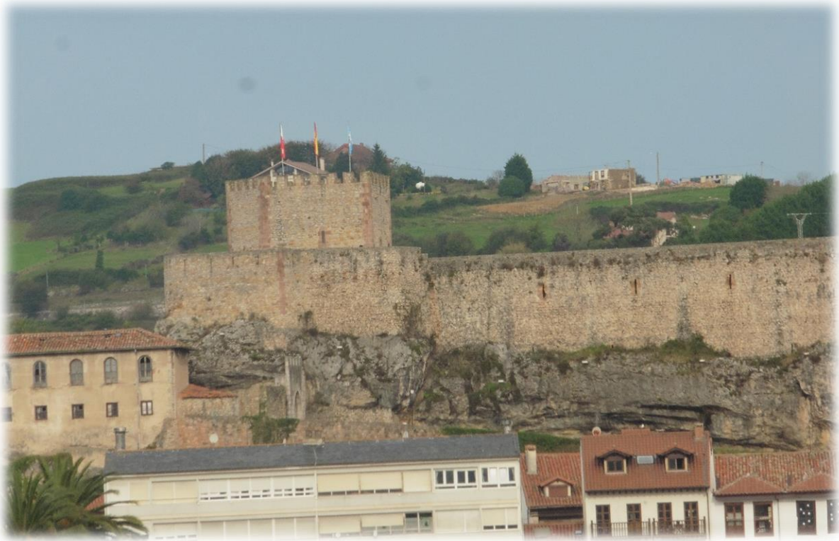
Middenin een uitwaaiende rivierdelta en tegen de achtergrond van de Picos de Europa ligt het Castillo del Rey. Dit kasteel werd in 1210 gebouwd en was in het verleden van groot strategisch belang.