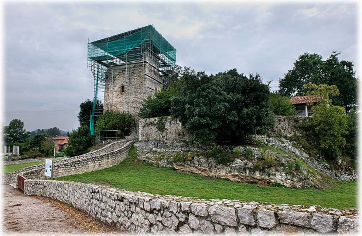
De Torre Estrada werd gebouwd in de 8 ste eeuw en werd heropgebouwd in de 12 de eeuw. Momenteel zijn er terug restauratiewerken aan de gang.