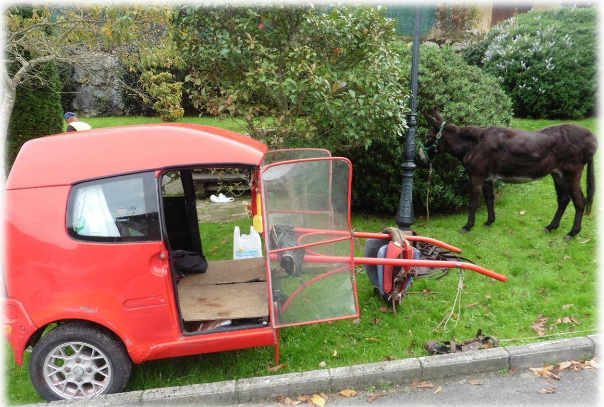
We ontmoeten een pelgrim die een karretje heeft gemaakt van een kleine auto. Het karretje laat hij voorttrekken door een ezel.