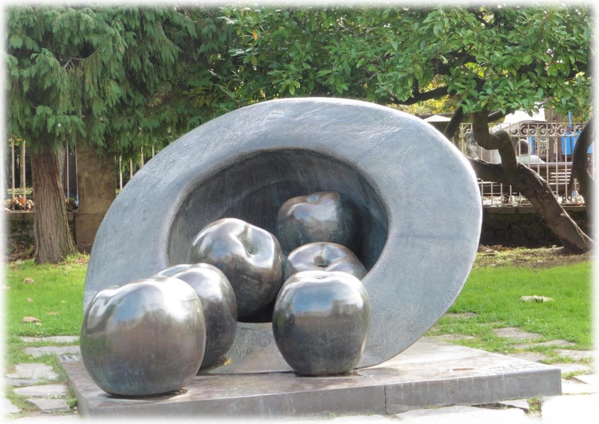
In het centrum van het dorp staat een monument dat er ons doet aan denken dat we door de streek van de cider trekken.