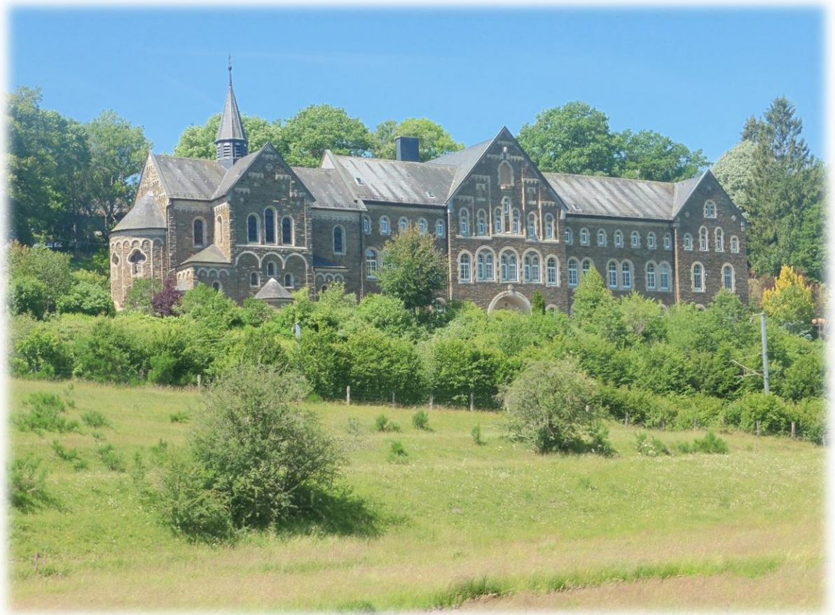
Het klooster van Cinqfontaines werd gebouwd door de Priesters van het Heilig Hart in 1903 als vormingscentrum voor jonge priesters die naar de missie in Congo en Brazilië vertrokken.