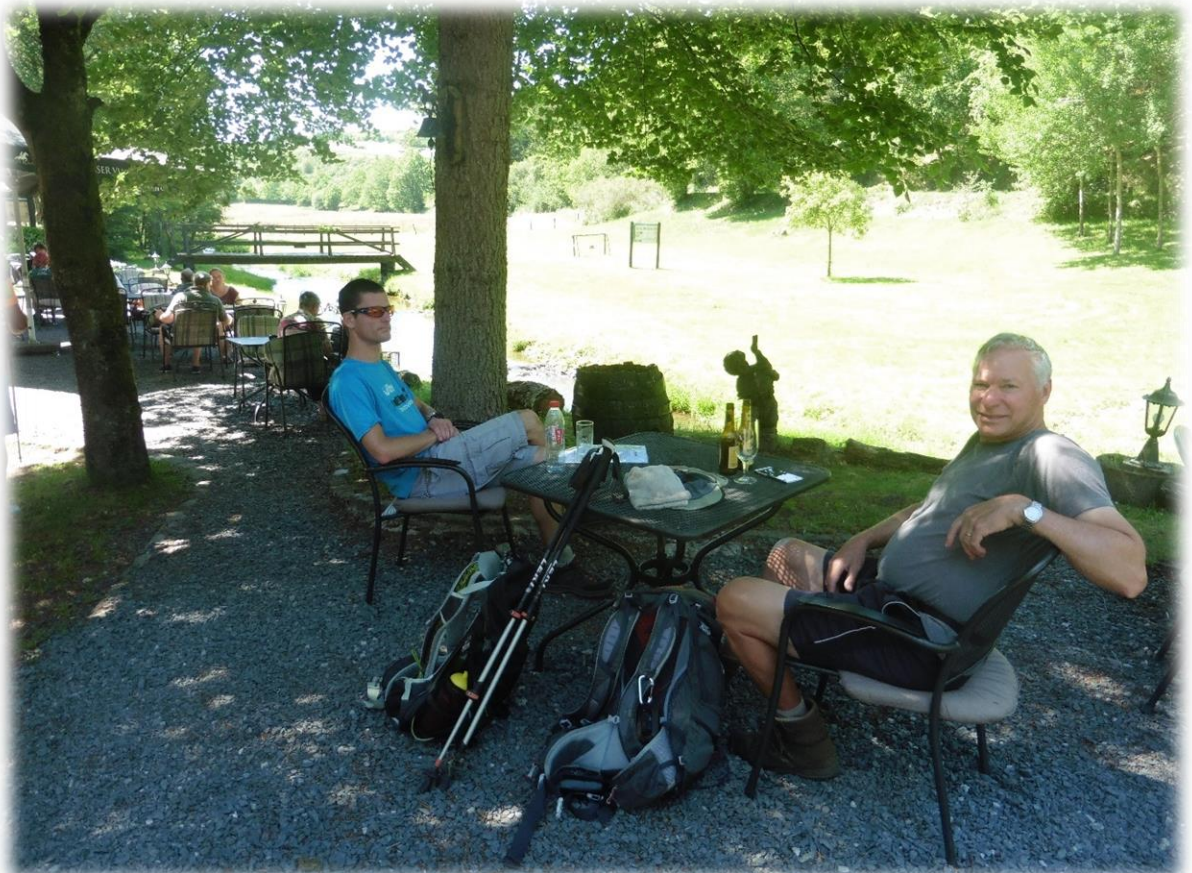
Na een toch wel vermoeiende en warme dag, zijn we aangekomen aan de Molen van Asselborn. Meteen zoeken we een schaduwrijke plaats op in de prachtige tuinen rond de