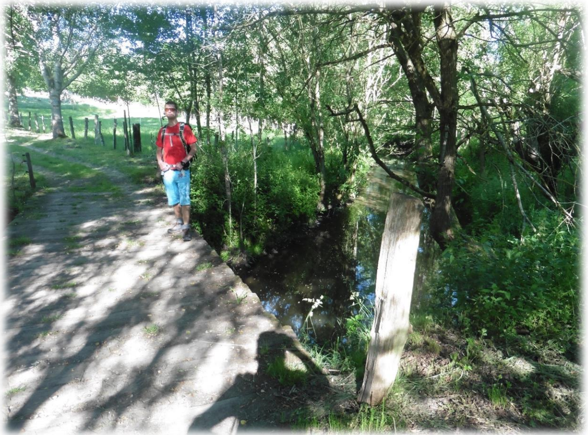
Onze wandeling vandaag gaat deels door Luxemburgs en deels door Belgisch grondgebied.