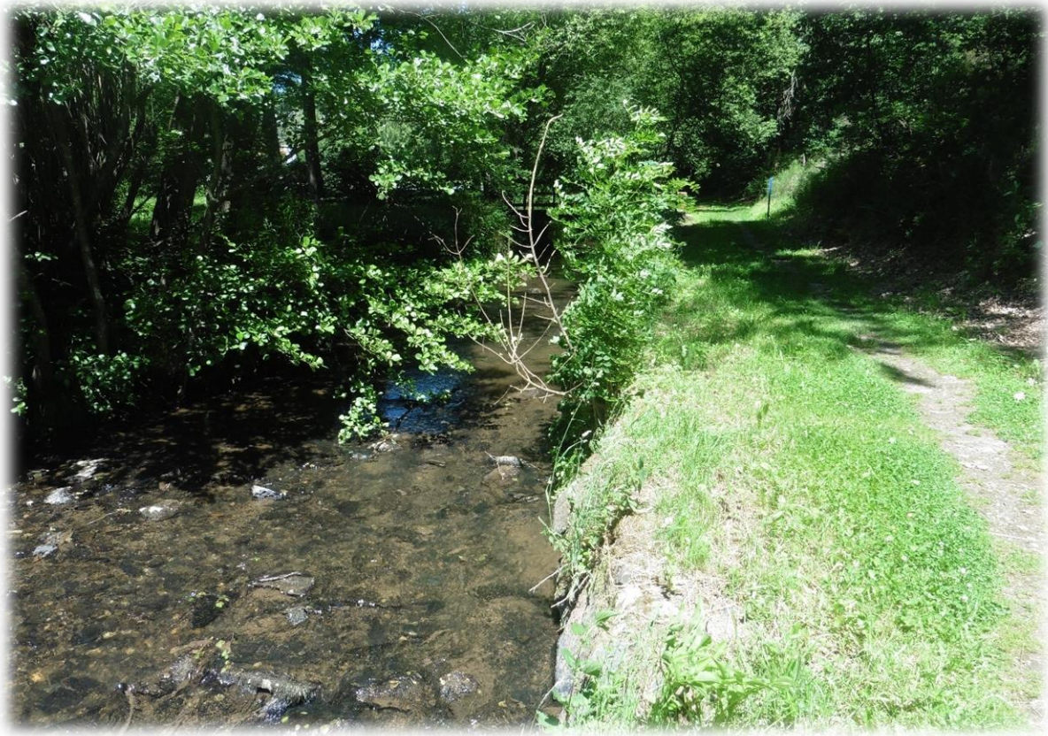
De vallei van de Woltz laat stroomafwaarts van Troisvierges een charmant landschap zien van