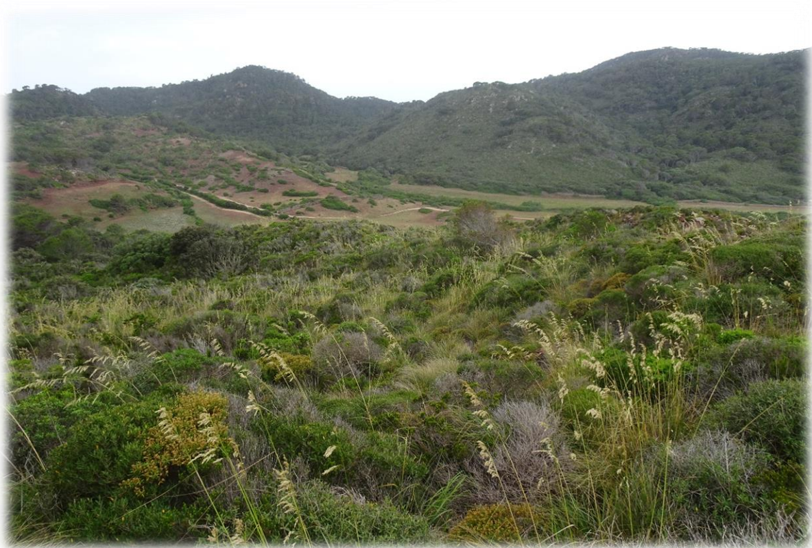
Dit grote elegante groenblijvende gras, diss grass met een basis van gebogen groene bladeren waaruit hoge bleke stengels met lange hangende bloemhoofdjes ontspringen.