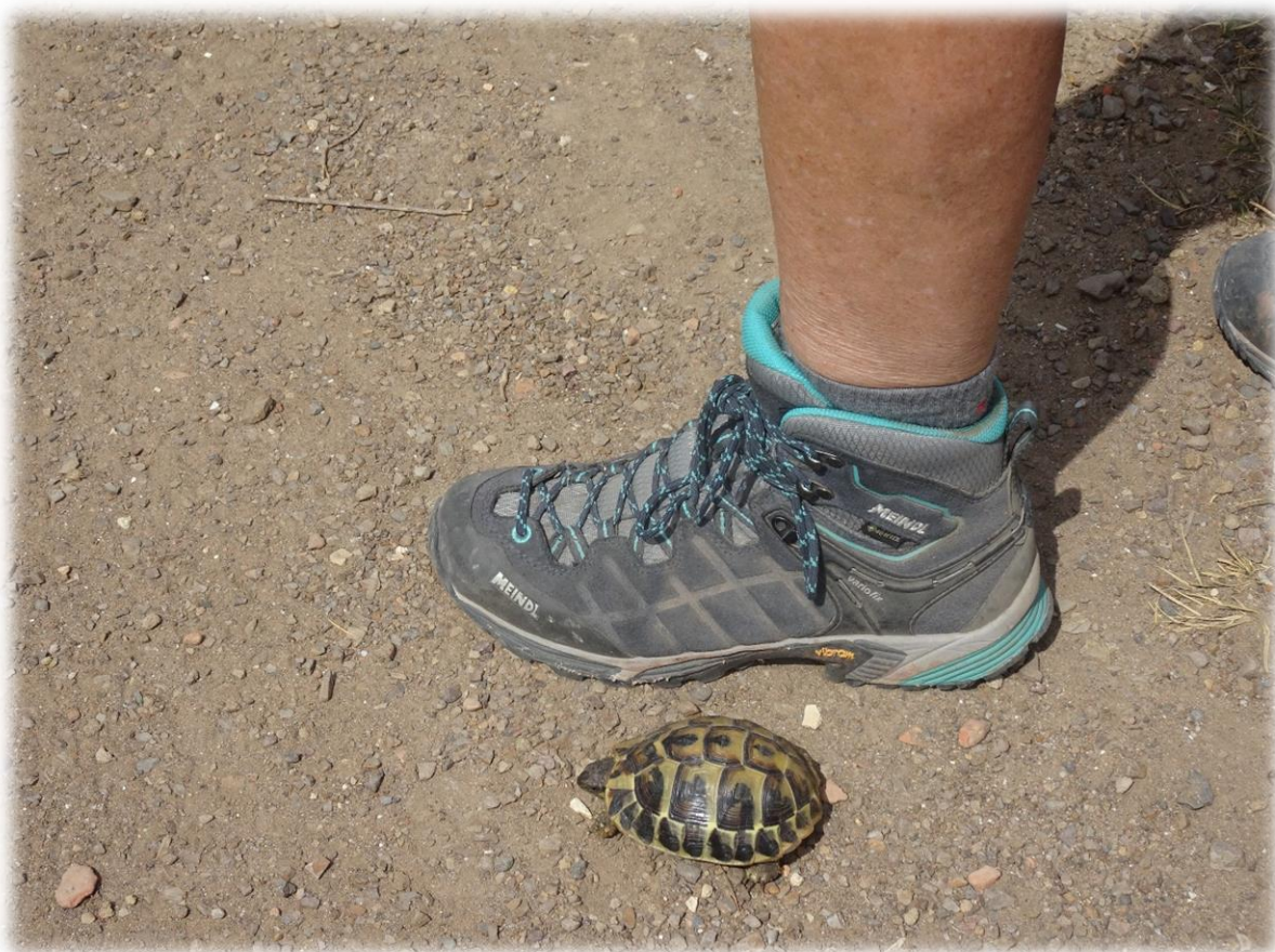
Een jonge Griekse landschildpad kruist ons pad.