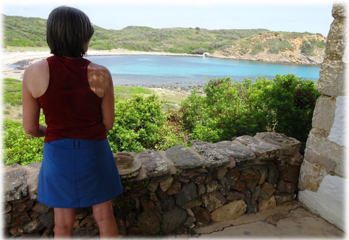
We rusten even uit aan een eenvoudig huisje waar we schaduw hebben..