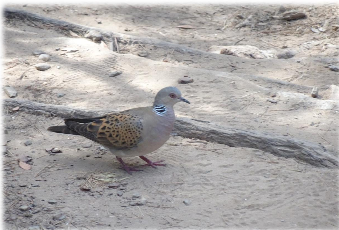
De zomertortelduif is de kleinste Europese duif en ze overwintert in Afrika ten zuiden van de Sahara maar broedt in grote delen van Europa.