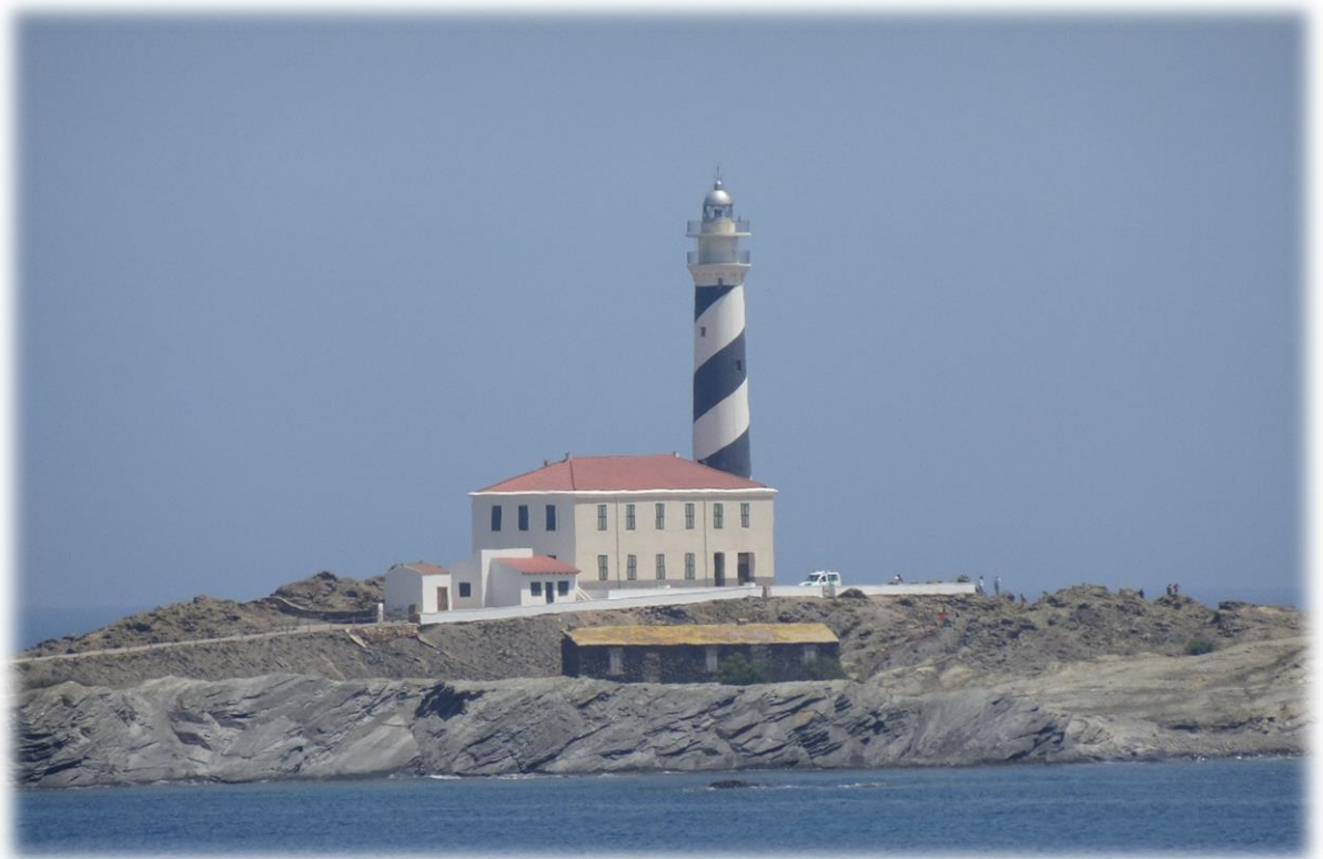
De Favaritx vuurtoren is de eerste betonnen toren die ooit werd gebouwd op de Balearen. De toren is 28 meter hoog en is de meest bezochte toren op het eiland.