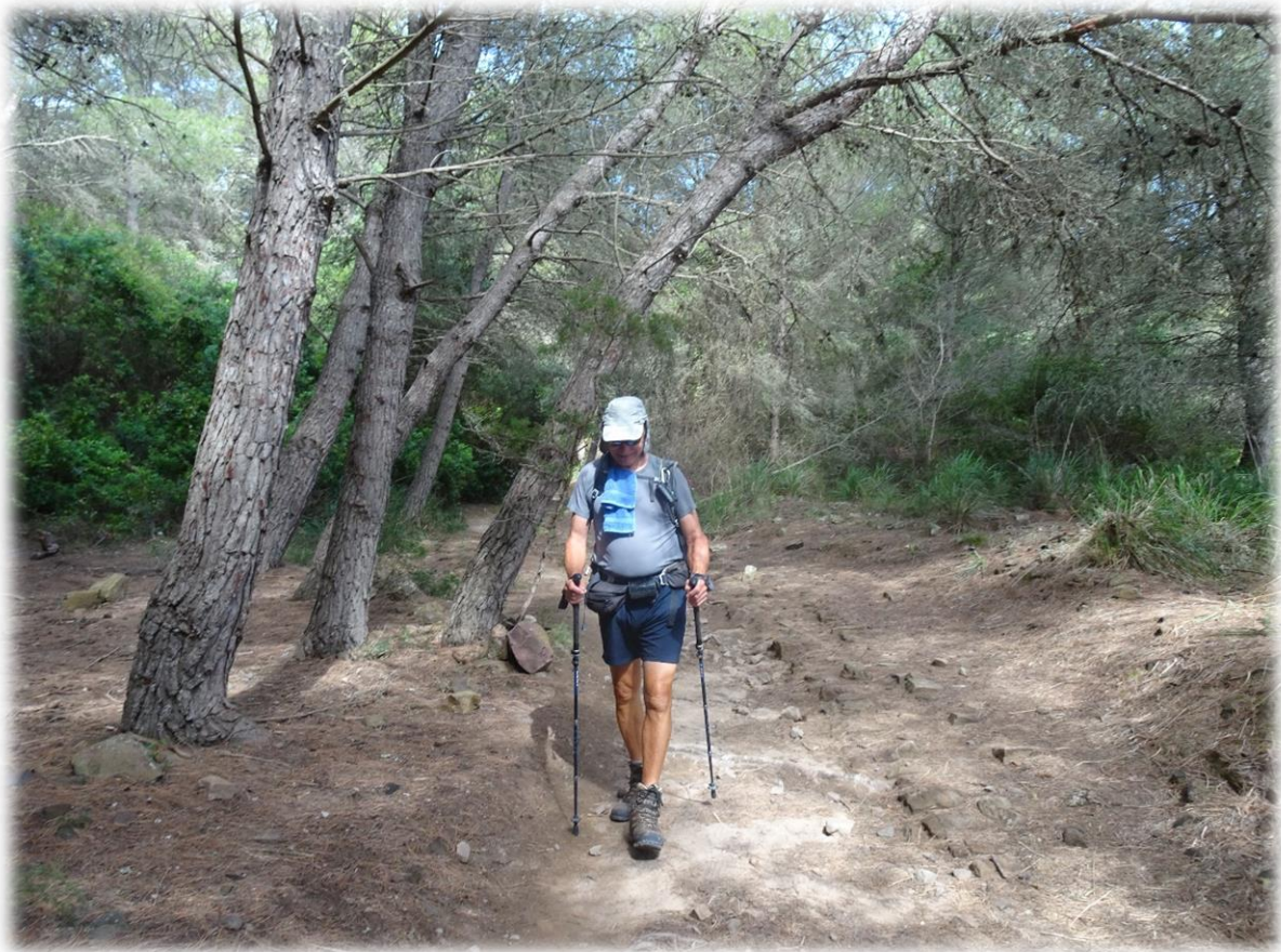
Onze laatste wandeldag. We profiteren van het mooie weer en maken een grote wandeling langs de Cami de Cavals.