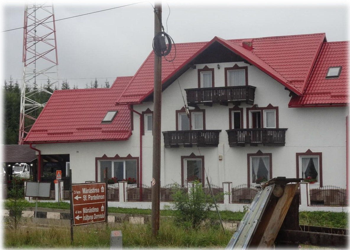
Ik werp nog een laatste blik op het hotel waar ik voorbij nacht heb gelogeed.