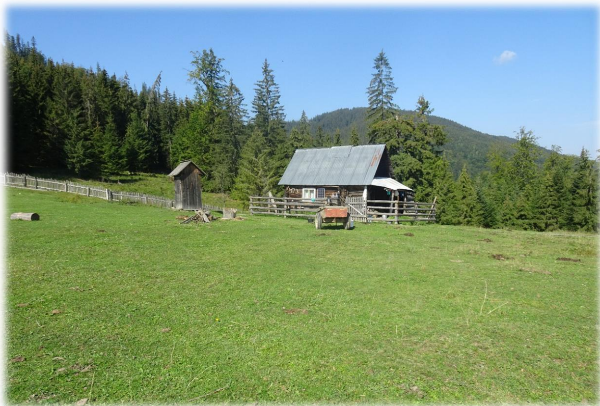
Kleine boeren wonen vaak op de alm, zoals hierboven. Het kleine huisje naast de woning is het toilet.