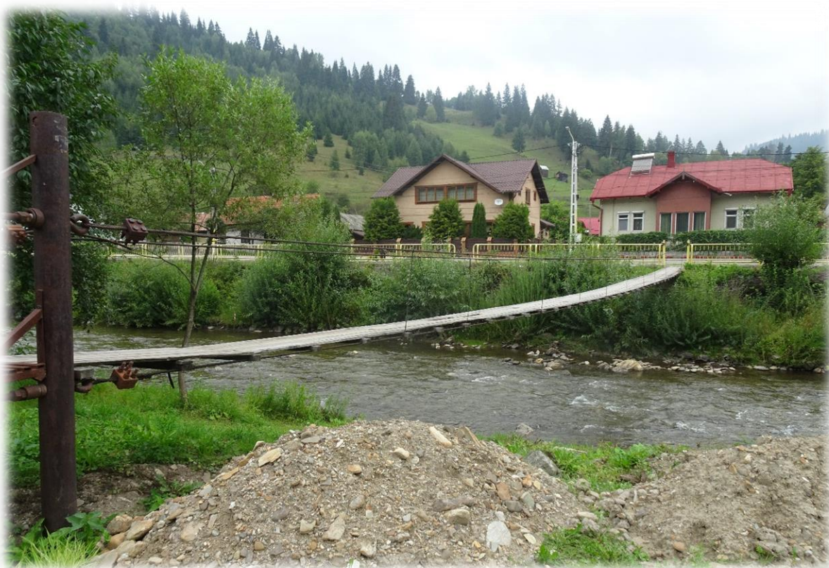
Deze wiebelende hangbrug heb ik moeten oversteken. Maar al bij al viel het wel mee.