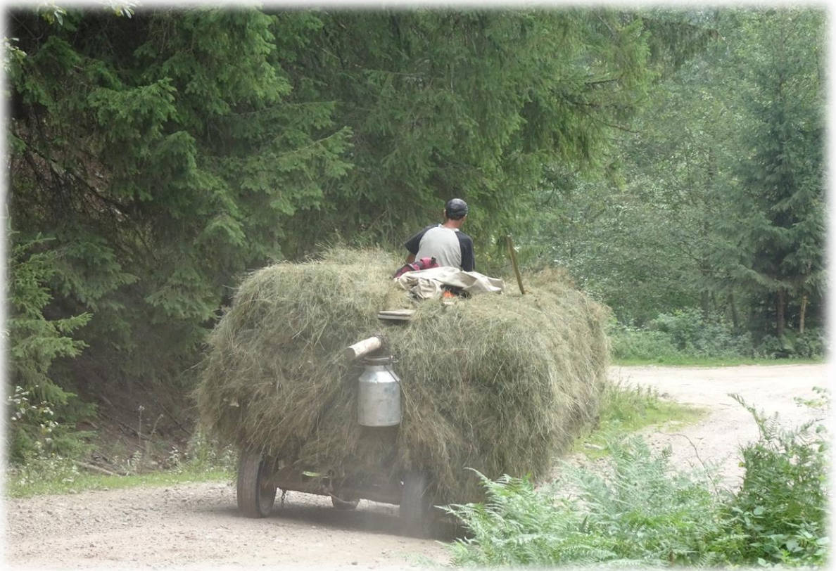
Een plaatselijke boer haalt nog vlug het hooi binnen voor de regen.