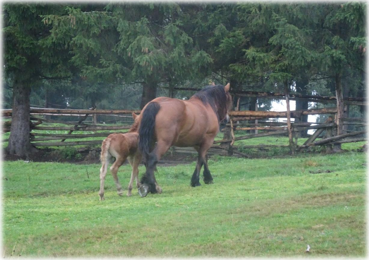
Paard en veulen lopen rustig rond op de alm.