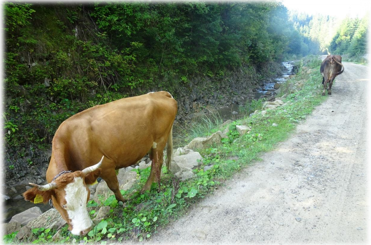
Koeien, paarden, schapen en geiten lopen hier redelijk vrij rond. Deze dieren trekken zich niets aan van passerende wandelaars.